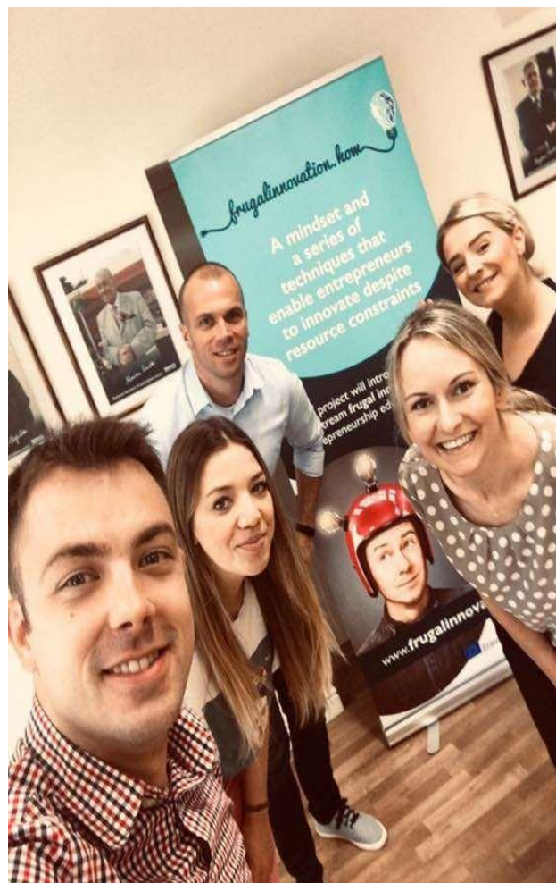
Slika: Partnerski sastanak u Szczecinu, Poljska

Partnerski sastanak je prošao u prijateljskoj atmosferi, kao što se može vidjeti na slikama.